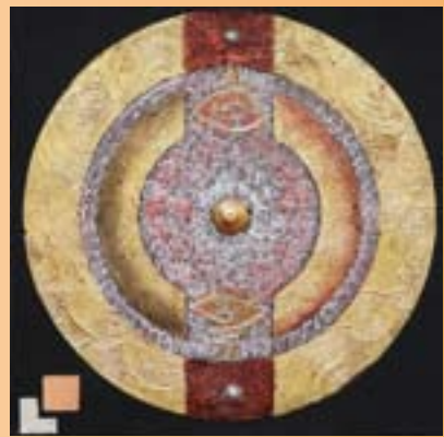
1. Golden Rice and Lotus 2. Silver Circle 3. Inspiration I 4. Inspiration II 5. Big Buddha with Lotus 6. Universe 7. Old Lannah 8. Inspiration III 9. Golden Circle