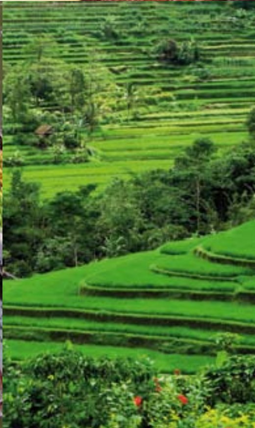
Sonnenhelle Strände, Tempel, schwimmende Märkte und das leuchtende Grün der Reisterrassen machen Thailand zum Sehnsuchtsziel.