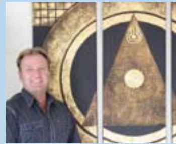
Goldene Gemälde für eine goldene Atmosphäre