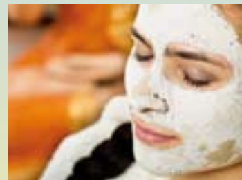
So nutzen Sie alles Wissen und alle Kräfte von Living Nature